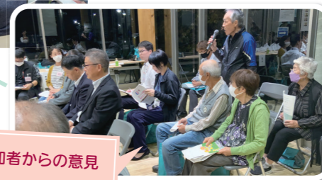
6 参加者からの意見