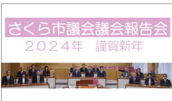
2024年 議会報告会動画