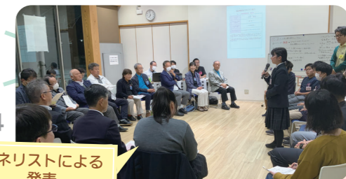
4 パネリストによる 発表