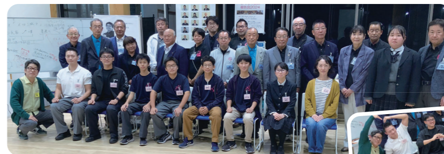
議員とパネリスト