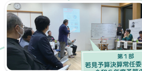
2 第1部 若見予算決算常任委員長より 令和6年度予算の説明